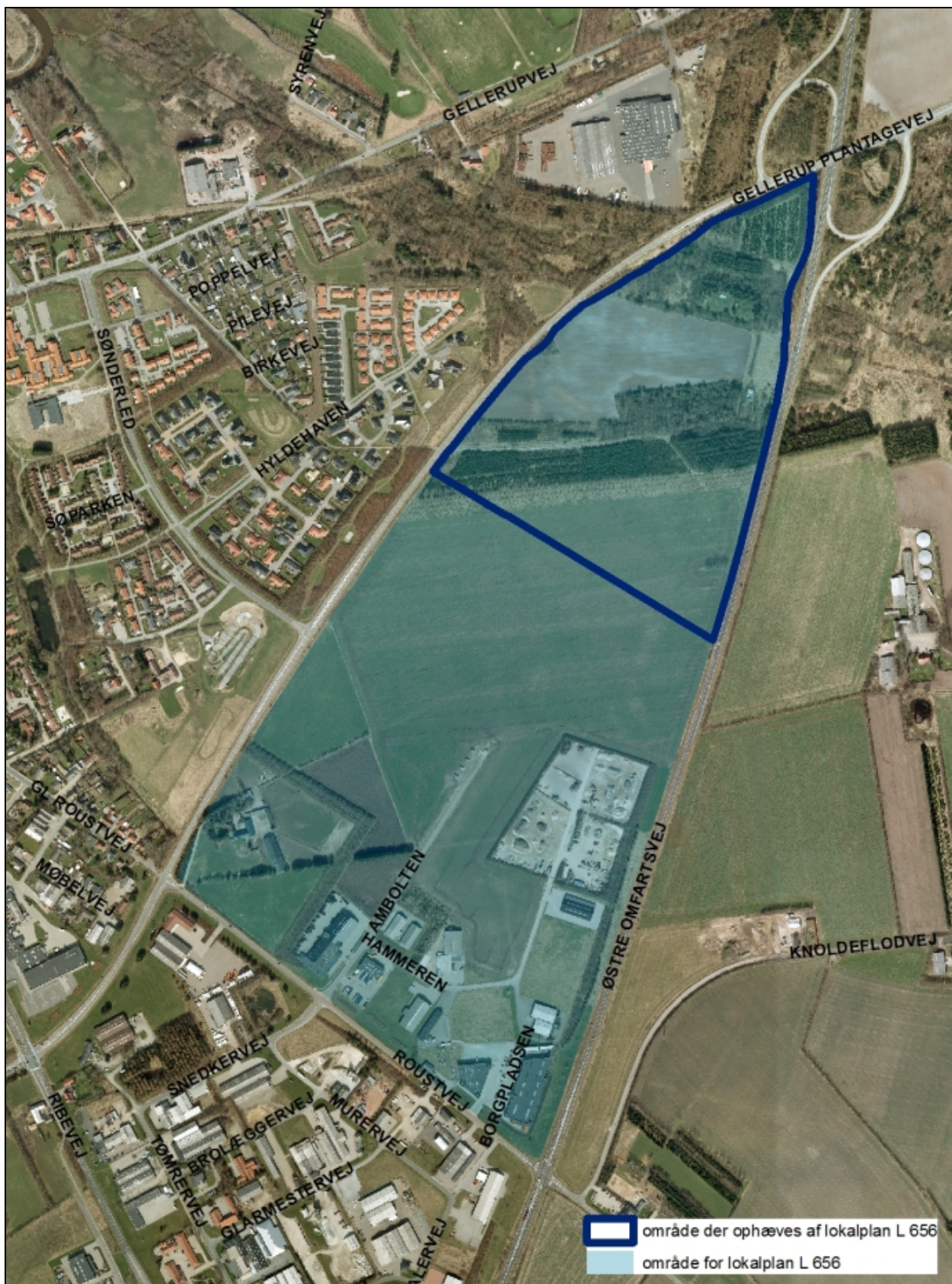
Lokalplanområdet på baggrund af luftfoto.